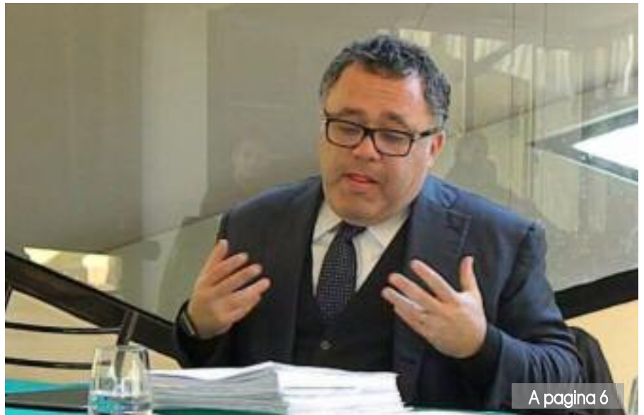
A pagina 6