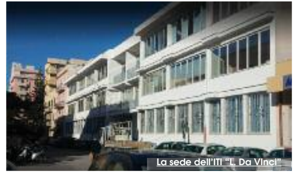
La sede dell'ITI "L. Da Vinci"

d'inquinamento spaziale. La competizione è articolata in tre parti. Ci spiega Palermo "Nella prima fase occorre inviare un "codice funzionante" che permettesse (mediante una simulazione) di oltrepassare i detriti e agganciare il satellite. Il funzionamento del Codice, è stato verificato con una proiezione 2D. Nella seconda fase, si è raggiunta la terza dimensione (3D). Al termine di questi primi step, è stata stilata la graduatoria (trasmessa a livello nazionale) che ha classificato gli "Space Hunters" primi nella competizione. La fase appena decorsa è invece quella dell'"Alleanza", siglata con altre squadre di continenti differenti da quello europeo". Gli Space Hunters, hanno scelto di collaborare con ragazzi provenienti da scuole dell'Oregon e di Saratoga. I 5 cacciatori spaziali di Trapani, in questi mesi, sono "sopravvissuti" alle 3 fasi di una disputa internazionale, sono diventati bersaglio di una bolgia mediatica che li ha ingiustamente privati del meritato e "sudato" primo posto (poi effettivamente riconosciuto) fino a giungere alla fase conclusiva del progetto. Il 28 prossimo, in una delle aule del M.I.T., attraverso un proiettore, gli "Space Hunters" vedranno il loro codice girare sulla I.S.S. (stazione spaziale internazio-