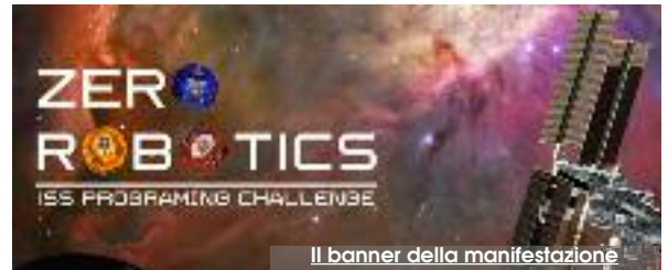
Il banner della manifestazione

nale). "Nessuno può sapere precisamente cosa accadrà! - sottolineano - Quando ci si muove in una dimensione spaziale, possono subentrare circostanze al di fuori di qualsiasi previsione. Anche se le simulazioni sono andate bene, in queste fasi ci siamo mossi in contesti che non possono perfettamente ricreare la realtà spaziale, dunque non possiamo tener conto pienamente di tutte le varianti". Tra gli sponsor dei "nostri" ragazzi ci sono, tra gli altri, i Comuni di Trapani, Erice e